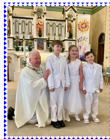
Pirma komunija 1st Eucharist