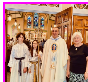
Motinos diena / Mother's Day