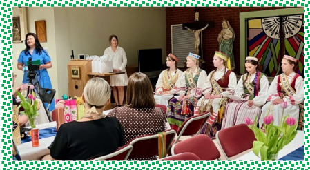
Boston Lithuanian School Graduation