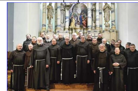
Broliai pranciškoniai persiskirstė valdžią: Tarnystės provincijoje 2025-2027 Franciscan brothers meet to elect new candidates for directing their Religious Centers

Pakutuvėnai Parish, near Plungė, LT Consists of: