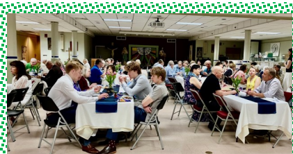
Bostono lituanistinės mokyklos baigimas