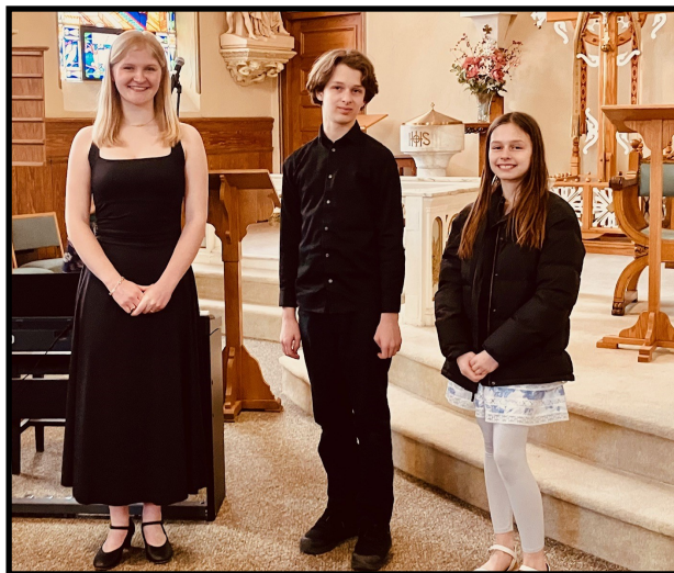
Jaunimo koncerto atlikėjai 2026.4.26 Youth concert performers

6/14/2026 Gedulo ir vilties diena— paminėjimas po 10:30 val. Mišių—rengia Bostono LB/ Commemoration of the Tragic Days of June after 10:30 Mass—Lithuanian American Community, Boston Chapter