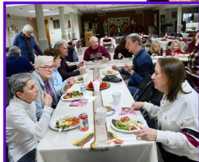
Savanorų padėkos pietūs/ Volunteer thank-you lunch